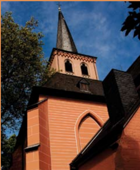
Grafik-Design: Barbara Hüskes