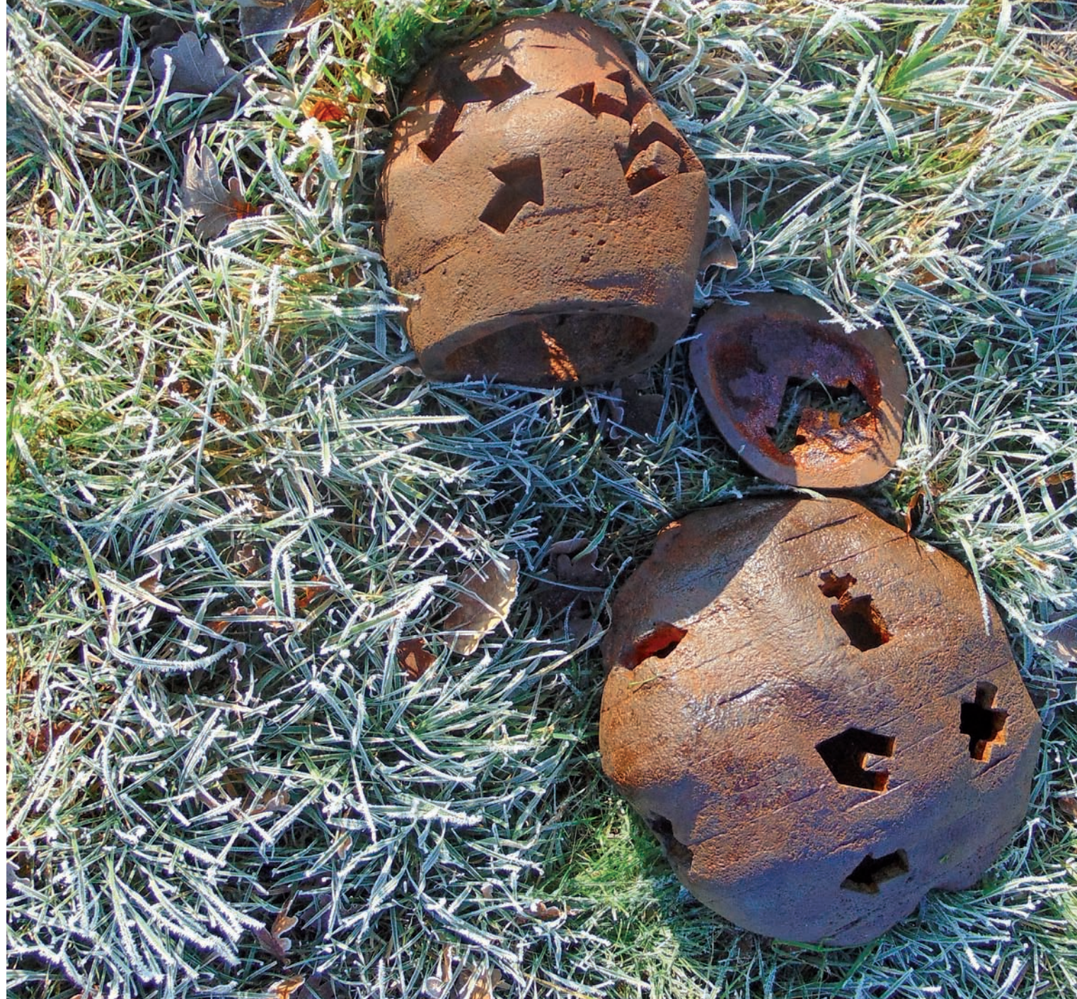
Meteorit I und III | 2016 | Eisenguss | Durchmesser 32 cm